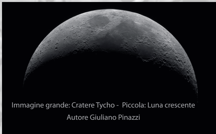
Immagine grande: Cratere Tycho - Piccola: Luna crescente

Tutte le serate sono pubbliche; non serve prenotazione; costo del biglietto: 6,00€ intero, 4,00€ ridotto (ragazzi fino 12 anni) ; entrata gratuita per bambini età prescolare, disabili con 1 accompagnatore, soci Circolo Astrofili Veronesi (esibire la tessera).