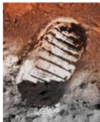
L'impronta dell'uomo sulla Luna

Sarà inoltre allestito un planetario con sette spettacoli giornalieri gratuiti il 24 luglio e il 28 agosto, sempre nella Sala Nervi di via Cappello. Informazioni e prenotazioni solo tramite e-mail a info@astrofiliveronesi.it . • F.S.A.G.L.